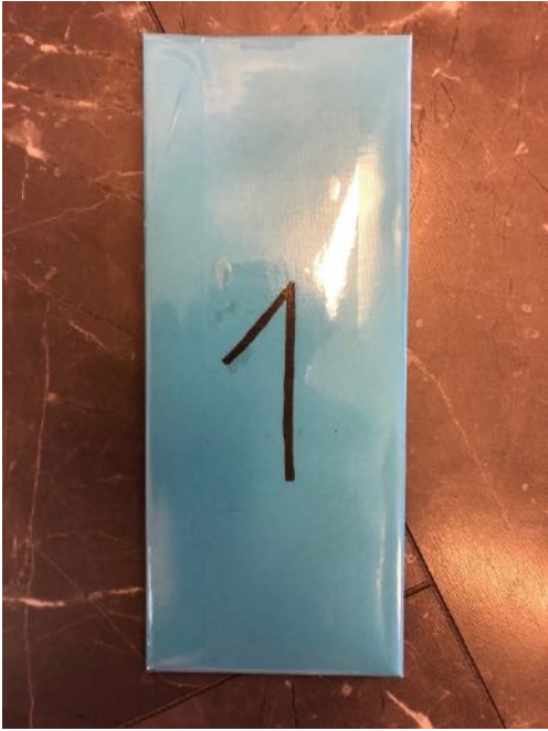
Blaue Karte / Herren