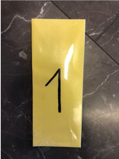
gelbe Karte / Damen